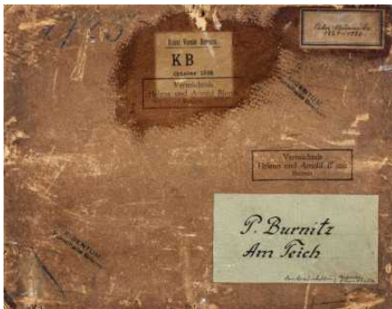
Provenienzforschung in der Kunsthalle Bremen