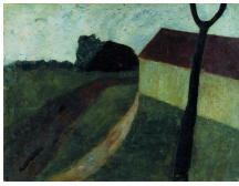
↗ Paula Modersohn-Becker (*Dresden 1876 - † Worpswede 1907), Malerin Dämmerungslandschaft mit Haus und Astgabel , um 1900