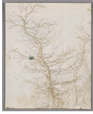
↗ Abraham Bloemaert (*Gorinchem (Gorkum) 1566 - † Utrecht 1651), Zeichner Studie kahler Bäume , 1581-1651