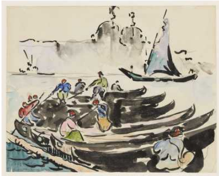
Digitalisierung der franzsischen und japanischen Graphik