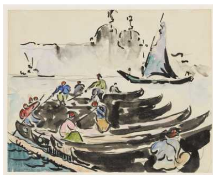
Digitalisierung der französischen und japanischen Graphik