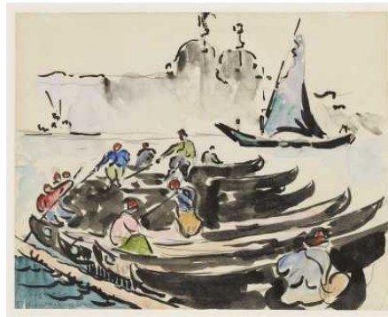
Digitalisierung der französischen und japanischen Graphik