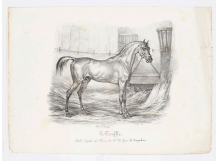
↗ Carle Vernet (*Bordeaux 1758 - † Paris 1836), Lithograph François Séraphin Delpech (*Paris 1778 - † 1825), Drucker Le Truffle, aus: "Große Folge von Pferden", 1818-1825