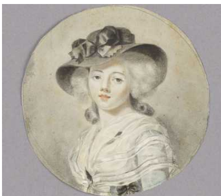
Restaurierung der französischen Zeichnungen des 15.-18. Jahrhunderts