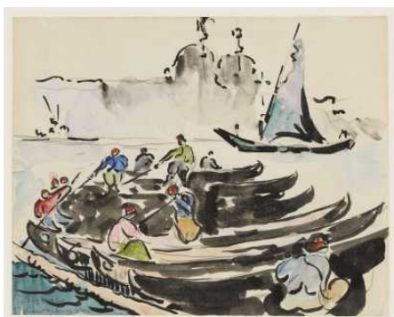
Digitalisierung der französischen und japanischen Graphik

↗ Anonym, französisch, 17. Jahrhundert (*1601 - † 1700), Zeichner Bacchantenzug , 17. Jahrhundert