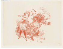
↗ Adolphe Willette (*Châlons-sur-Marne 1857 - † Paris 1926), Lithograph Montmartre Maskerade , 1897