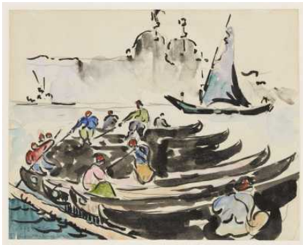
Digitalisierung der französischen und japanischen Graphik