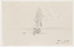
↗ Johan Barthold Jongkind (*Lattrop 1819 - † Saint-Egrève bei Grenoble 1891), Zeichner Segelschiff auf dem Meer , 1834-1891