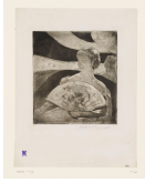
↗ Mary Cassatt (*Allegheny City, Pennsylvania 1844 - † Château de Beaufresne bei Oise, Frankreich 1926), Radiererin In der Oper , um 1880