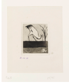
↗ Félicien Rops (*Namur 1833 - † Essonnes (bei Paris) 1898), Radierer Japanischer Storch , 1848-1898