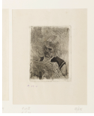
↗ Félicien Rops (*Namur 1833 - † Essonnes (bei Paris) 1898), Radierer Russischer Priester , 1874