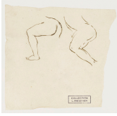
↗ Eugène Delacroix (*Charenton-Saint-Maurice 1798 - † Paris 1863), Zeichner Zwei Beine , 1813-1863