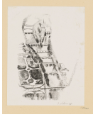
↗ Robert Delaunay (*Paris 1885 - † Montpellier 1941), Lithograph Brücken (und Île de la Cité), aus: "Allo Paris", 1926