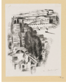
↗ Robert Delaunay (*Paris 1885 - † Montpellier 1941), Lithograph Brücken, aus: "Allo Paris", 1926