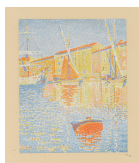
↗ Paul Signac (*Paris 1863 - † Paris 1935), Lithograph Seehafen Chioggia , 1894