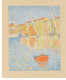
↗ Paul Signac (*Paris 1863 - † Paris 1935), Lithograph Seehafen Chioggia , 1894