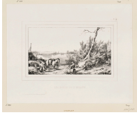
↗ Nicolas-Toussaint Charlet (*Paris 1792 - † Paris 1845), Lithograph Les bords de l'Escaut, Blatt 4 der Folge "Skizzen", 1837