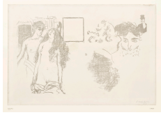
↗ Pierre Bonnard (*Fontenay-aux-Roses 1867 - † Le Cannet 1947), Lithograph Letzter Kreuzzug , 1896