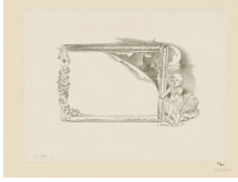
↗ Adolphe Willette (*Châlons-sur-Marne 1857 - † Paris 1926), Lithograph Putto mit Rahmen , 1872-1926