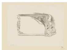
↗ Adolphe Willette (*Châlons-sur-Marne 1857 - † Paris 1926), Lithograph Putto mit Rahmen , 1872-1926