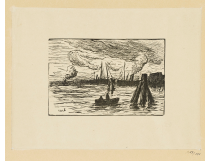
↗ Maximilien Jules Luce (*Paris 1858 - † Paris 1941), Formschneider Hafen , 1912