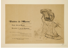
↗ Antonio de la Gandara (*Paris 1861 - † Paris 1917), Lithograph Prospektprogramm für Théâtre de l'Œuvre, 1895, 1895