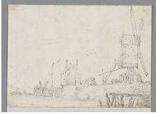
↗ Flußlandschaft mit Windmühle, Haus und Fischern , 1611-1656