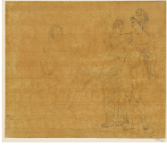
➤ Théodore Géricault (*Rouen 1791 - † Paris 1824), Zeichner Studienblatt nach antiken Statuen , 1816-1817