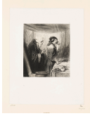
↗ Paul Gavarni (*Paris 1804 - † Auteuil 1866), Lithograph Satan , aus: "Les Artistes anciens et modernes" , 1819-1866