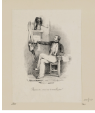
↗ Nicolas-Toussaint Charlet (*Paris 1792 - † Paris 1845), Lithograph Repose toi, mais ne te rouille pas , 1828