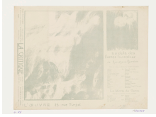
↗ Maurice Denis (*Granville 1870 - † Paris 1943), Lithograph Programm für "Au-dela des forces humaines" von B. Bjornson , 1897