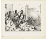
↗ Nicolas-Toussaint Charlet (*Paris 1792 - † Paris 1845), Lithograph Entwurf für: "L'allocution", 1830