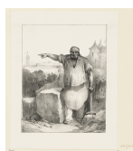
↗ Nicolas-Toussaint Charlet (*Paris 1792 - † Paris 1845), Lithograph Steinklopfer , 1830