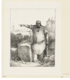
↗ Nicolas-Toussaint Charlet (*Paris 1792 - † Paris 1845), Lithograph Steinklopfer , 1830