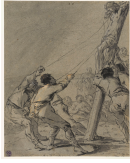
↗ Leonaert Bramer (*Delft 1596 - † Delft 1674), Zeichner Aufrichtung des Kreuzes, Blatt 46 der Folge "Szenen aus dem Neuen Testament", 1630er