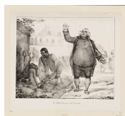
↗ Nicolas-Toussaint Charlet (*Paris 1792 - † Paris 1845), Lithograph Le soleil luit pour tout le monde , 1823