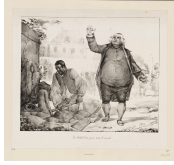
↗ Nicolas-Toussaint Charlet (*Paris 1792 - † Paris 1845), Lithograph Le soleil luit pour tout le monde , 1823