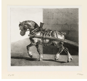
↗ Anonym, Lithograph nach Théodore Géricault (*Rouen 1791 - † Paris 1824), Inventor Apfelschimmel in Geschirr , nach 1806