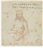
↗ Albrecht Dürer (*Nürnberg 1471 - † Nürnberg 1528), Zeichner Selbstbildnis, krank , um 1506/07