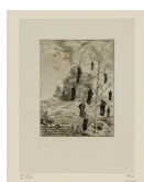
➤ Félix Bracquemond (*Paris 1833 - † Sèvres 1914), Radierer Maulwürfe , 1854