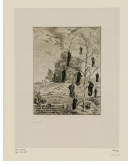
↗ Félix Bracquemond (*Paris 1833 - † Sèvres 1914), Radierer Maulwürfe , 1854