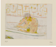
↗ Pierre Bonnard (*Fontenay-aux-Roses 1867 - † Le Cannet 1947), Lithograph Frau sitzt in der Badewanne , vor 14.8.1942