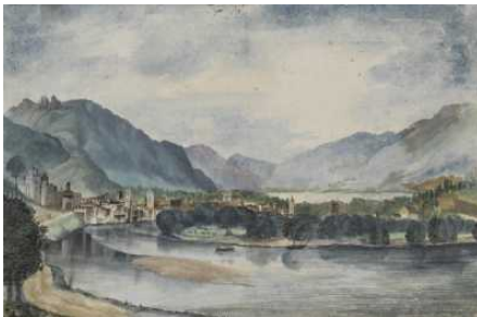
Die Sammlung Hieronymus Klugkist – Der Grundpfeiler des Bremer Kupferstichkabinetts

↗ Anonym, deutsch, 16. Jahrhundert (*1501 - † 1600), Formschneider alternative Zuschreibung Hans Burgkmair d. Ä. (*Augsburg 1473 - † Augsburg 1531), Formschneider Johann Adam von Bartsch (*Wien 1757 - † Wien 1821), Verleger Zwei Elche mit einem berittenen Jungen, der eine Tafel trägt, Blatt 17 aus: Marx Treitzsaurwein, "Kaiser Maximilian I Triumph – le triomphe de l'Empereur Maximilien I en une suite de Cent trent cinq planches gravées en bois d'après les dessins de Hans Burgmair", Wien 1796 , 1796