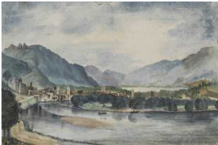
Die Sammlung Hieronymus Klugkist – Der Grundpfeiler des Bremer Kupferstichkabinetts

↗ Hans Burgkmair d. Ä. (*Augsburg 1473 - † Augsburg 1531), Formschneider Sechs Köpfe wohlhabender Personen , 1488-1531