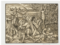
↗ Anonym, deutsch, 16. Jahrhundert (*1501 - † 1600), Formschneider Drei Männer am Weinberg vor einem Zelt , 16. Jahrhundert