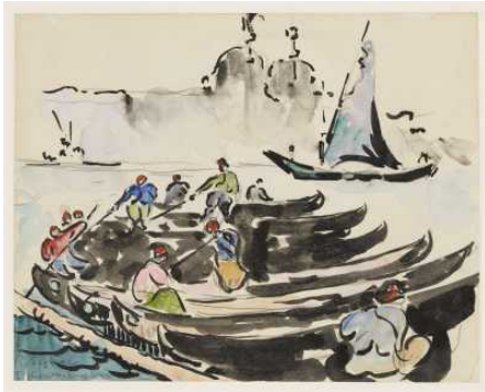
Digitalisierung der französischen und japanischen Graphik

↗ möglicherweise von Jacques-Louis David (*Paris 1748 - † Brüssel 1825), Zeichner alternative Zuschreibung Anonym, französisch, 18. Jahrhundert (*1701 - † 1800), Zeichner Mann mit zwei großen Reklametafeln , 1763-1825