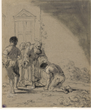
↗ Leonaert Bramer (*Delft 1596 - † Delft 1674), Zeichner Gleichnis vom verlorenen Sohn, Blatt 27 der Folge "Szenen aus dem Neuen Testament", 1630er