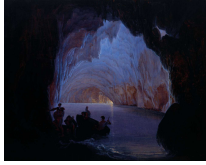
↗ Heinrich Jakob Fried (*Queichheim/Landau 1802 - † München 1870), Maler Die blaue Grotte von Capri , 1835