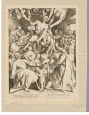
↗ Willem van Swanenburg (*Leiden 1580 - † Leiden 1612), Stecher Christus heilt den Kranken , 1595-1612