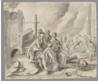
↗ Schmiede Vulkans , 1561-1627