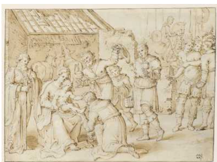
Restaurierung Niederländischer Zeichnungen des 15.-18. Jahrhunderts