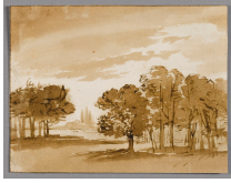
↗ Landschaft mit Bäumen , 1643-1654