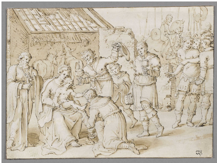
Restaurierung Niederländischer Zeichnungen des 15.-18. Jahrhunderts