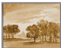
↗ Landschaft mit Bäumen , 1643-1654