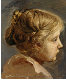
↗ Friedrich Wasmann (*Hamburg 1805 - † Meran 1886), Maler Mädchenbildnis , 1829