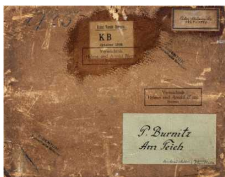
Provenienzforschung in der Kunsthalle Bremen