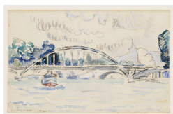
↗ Paul Signac (*Paris 1863 - † Paris 1935), Maler Pont Billy in Paris , 1900