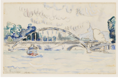
↗ Paul Signac (*Paris 1863 - † Paris 1935), Maler Pont Billy in Paris , 1900