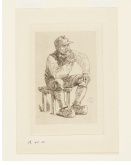
↗ Félicien Rops (*Namur 1833 - † Essonnes (bei Paris) 1898), Radierer Dorforakel , 1875