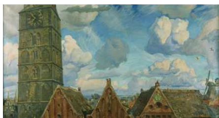
Bremer Malerei 1800 bis 1950 in der Kunsthalle Bremen

↗ Provenienzforschung in der Kunsthalle Bremen