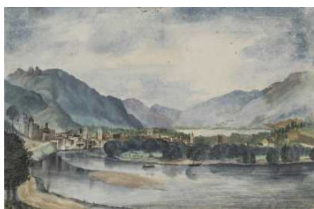
Die Sammlung Hieronymus Klugkist – Der Grundpfeiler des Bremer Kupferstichkabinetts