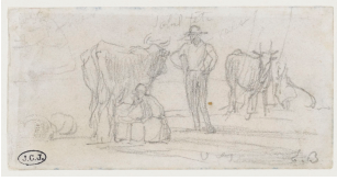
↗ Eugène Boudin (*Honfleur 1824 - † Deauville 1898), Zeichner Melkszenen auf der Weide , 1839-1898