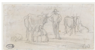
➤ Eugène Boudin (*Honfleur 1824 - † Deauville 1898), Zeichner Melkszenen auf der Weide , 1839-1898